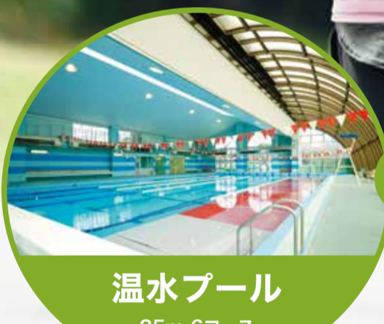
温水プール 25m 6コース