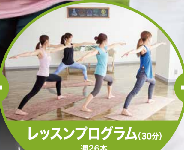
レクショナルプログラム(30分) 週26本 ※内容については裏面をご確認ください