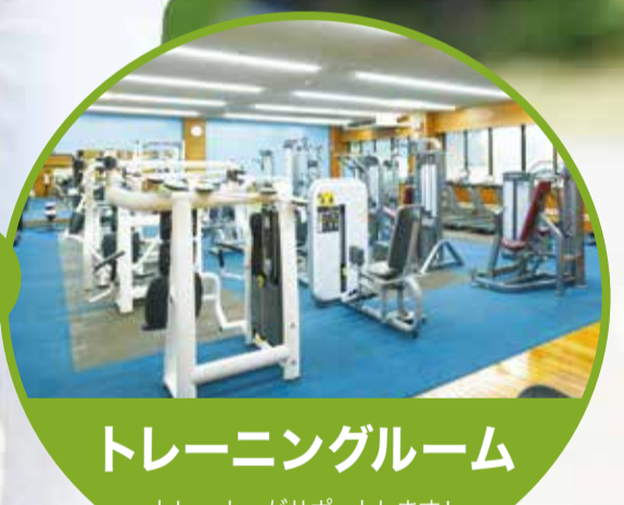
トレーニングルーム トレーナーがサポートします！